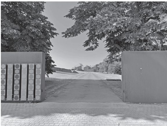
『SONS』のホームページより

知らない人が多いのが現状です。イタリアやフランス、またはカナダにある履物のミュージアムは出張や旅行の際に訪れたことがある方のお話をたまにお聞きしますが、この『SONS』についてはほとんど聞いたことがありません。しかし、このベルギーにある『SONS』も大変素晴らしい履物のコレクションたちを収蔵・展示しています。